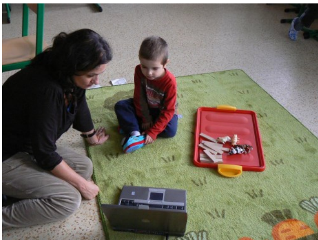
Napřed dítě hru sleduje

Metoda je snadná: nejde totiž o imitaci – dítě se nedívá na někoho, jak si hraje, co s hračkou dělá, aby takovou hru muselo „převést“ do motorického vzorce svých rukou. Na videu jsou vidět jen ruce a hračka. Ruce přehrají scénář, který dítě vidí. Potom vidí hračku, ke které dodá své ruce a vlastně z paměti přehraje totéž. V imitaci děti s PAS selhávají, ale v oblasti vizuální paměti naopak obvykle vynikají. Dítě scénář může opakovat s nějakou latencí, kdy scénáře dítě opakuje až třeba po několika dnech, kdy ho hračka k zopakování sama inspiruje, na pobytech vyžadujeme opakování okamžité, což děti dobře zvládají.