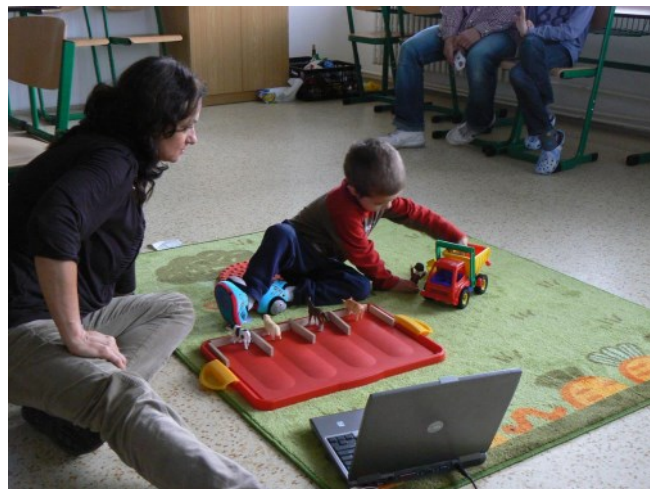
Zcela samo (bez další intervence druhé osoby) ji opakuje